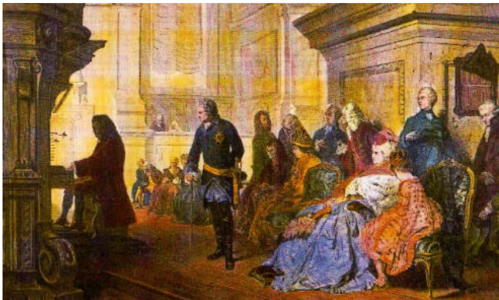
Figure 2. Bach jouant de l'orgue pour Frédéric le Grand

Par contre, la légende d'une illustration ou d'une figure se place normalement sous l'illustration.