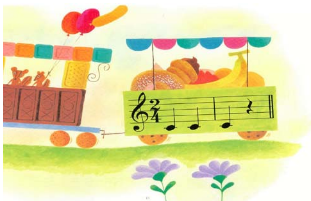
ILLUSTRATION 4. École de musique Yamaha, Musiclub des petits , 1992, p. 15

Il arrive même que la notation musicale soit insérée directement dans l'illustration couleur.