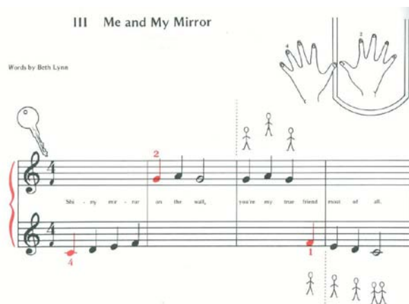
ILLUSTRATION 7. Susan Cheung, Lead Yourself to Music , 1986, p. 14

Il est important de souligner que lors de l'étape initiale, tous les traits visuels sont explorés. Lors de l'étape picturale, tous les éléments du symbole sont « photographiés » : la forme, la position, la couleur, etc. Il n'est donc pas rare, lors des premières leçons, de voir l'élève faire une association entre le symbole de la note musicale et le doigté indiqué au-dessus ou au-dessous de la note. D'ailleurs, plusieurs professeurs ont souvent l'impression que l'élève lit la musique en décodant les doigtés et non en faisant une lecture de la position de la note sur la portée. L'enfant ne fait aucune distinction entre les éléments caractéristiques d'un symbole, comme la position d'une note sur la deuxième ligne de la portée et les éléments sans lien véritable avec le code musical qui sont utilisés simplement pour « faciliter » la tâche du lecteur, comme l'ajout de couleur pour représenter certaines notes sur la portée. L'enfant peut très bien accorder son attention aux traits visuels plus captivants comme la couleur et négliger les traits plus complexes comme le positionnement d'une boule noire sur une portée de cinq lignes. L'élève débutant pourrait ainsi être capable de jouer à l'instrument simplement en percevant le code de couleur. Il est de plus en plus fréquent de voir certains manuels présenter des notes en couleur afin d'identifier, pour le jeune élève, des points de repère dans la partition musicale :