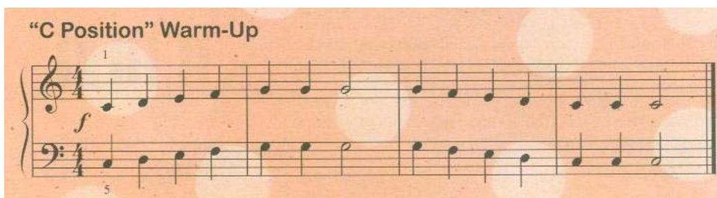
ILLUSTRATION 3. Janet Vogt et Leon Bates, Piano Discoveries , 2001, p. 18

La notation peut même être imprimée directement sur un fond de couleur, distraction pour l'œil qui tente de capter les notes disposées sur la portée.