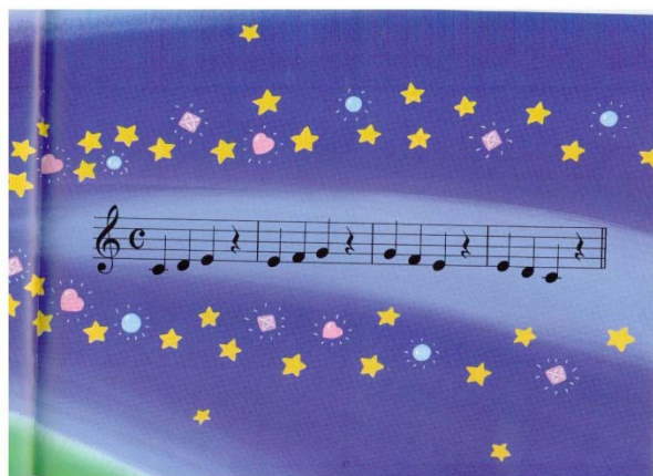
ILLUSTRATION 5. École de musique Yamaha, Musiclub des petits , 1992, p. 27

Peu d'études ont analysé l'effet des illustrations sur le processus de lecture musicale. Les recherches que nous avons effectuées (Liu, Comeau, 2009 ; Lemay, Comeau, 2008) ont certainement démontré que lors de la lecture d'une partition musicale sur une page avec illustrations colorées, un nombre important de fixations se sont portées directement sur les aires illustrées, alors que pour une partition sans illustration, la presque totalité des fixations s'effectuent sur la notation. Ainsi, dans le premier cas, les aires visuelles du cortex sont occupées en partie à enregistrer les illustrations, alors que dans le second cas, toute l'attention est mise sur la notation musicale.